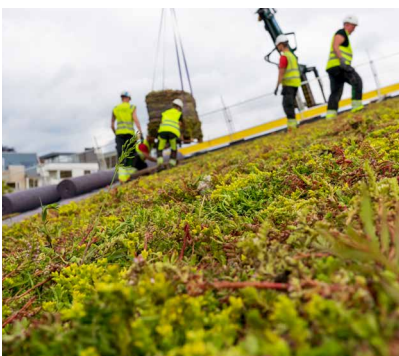
Legging av sedum på skrått tak.

Sedum er betegnelsen på forskjellige bergknapparter i bergknappfamilien. Dette er lavvokste, sukkulente planter som stiller lite krav til sitt voksested. I naturen vokser de på svaberg og berg- knauser. De er tørketålede og egner seg derfor godt på taket. Artene i sedummatte er 5–10 cm høye og har gule, rosa eller hvite blomster. Sedum krever lite vedlikehold, men likevel er gjødsling og fjerning av ugress avgjørende for at taket skal holde seg grønt og frodig år etter år.