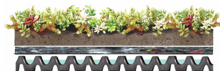
Ferdig utlagt sedumsystem. Dreneringsmatter fungerer som vannreservoar.