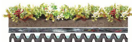
Ferdig utlagt sedumsystem. Dreneringsmatter fungerer som vannreservoar.