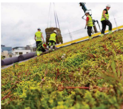
Legging av sedum på skrått tak.

Sedum er betegnelsen på forskjellige bergknapparter i bergknappfamilien. Dette er lavvokste, sukkulente planter som stiller lite krav til sitt voksested. I naturen vokser de på svaberg og berg- knauser. De er tørketålede og egner seg derfor godt på taket. Artene i sedummatte er 5–10 cm høye og har gule, rosa eller hvite blomster. Sedum krever lite vedlikehold, men likevel er gjødsling og fjerning av ugress avgjørende for at taket skal holde seg grønt og frodig år etter år.